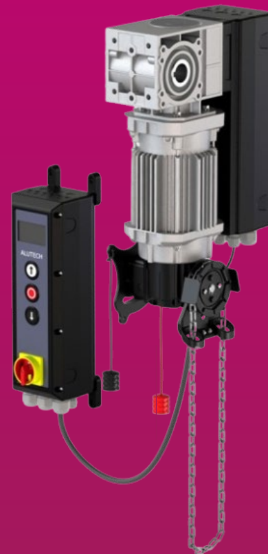
Высокоскоростной привод HS140-S