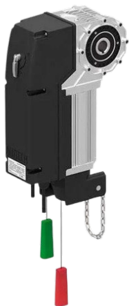
Привод Targo с внешним блоком управления