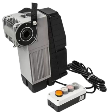
Привод Targo со встроенным блоком управления